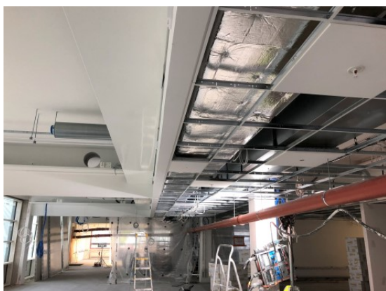
Alakattojen runkotyöt käynnissä.

Väliseinämuurauksia 1 krs. Maalaustyöt käynnissä 2 ja K1 krs. Tasoitetyöt käynnissä K1 ja 1 krs. Levyväliseinätyöt käynnissä 2 krs. Vesikaton peltityöt käynnissä Timanttioraustyöt käynnissä LV ja S-työt käynnissä 3 -2, K1 - K2 krs. Sprinkler-työt käynnissä K2 krs. IV-asennustyöt käynnissä Märkätilojen laatoitustyöt käynnissä Sokkelirakenteiden muottitöitä Alakattotyöt käynnissä 2 krs. Metalli-ikkunoiden asennus käynnissä Maanrakennustyöt käynnissä lounaispuolelle