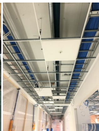
Alakatto asennukset käynnissä 3 krs.