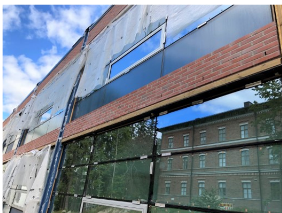
Metalli-ikkuna asennusta pohjoispäädyssä.

Väliseinämuurauksia 1 krs. Maalaustyöt käynnissä K1 krs. Tasoitetyöt käynnissä K1 ja 1 krs. Levyväliseinätyöt käynnissä 3-2 krs. Timanttioraustyöt käynnissä LV ja S-työt käynnissä 3 -2, K1 -K2 krs. Sprinkler-työt käynnissä K2 krs. IV-asennustyöt käynnissä IV-konehuone ja 2.krs Märkätilojen laatoitustyöt käynnissä 1 krs. Sokkelirakenteiden muottitöitä Alakattotyöt käynnissä Metalli-ikkuna asennus käynnissä Plaano valmisteluja 2.krs