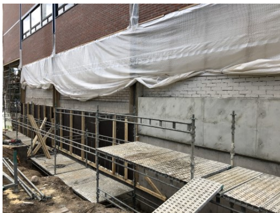
Sokkelirakenteiden betonointityöt jatkuvat