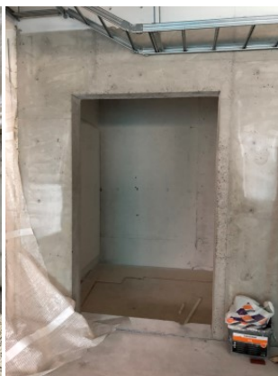
Uusi hissikuilu valmiina uutta tavarahissiä varten