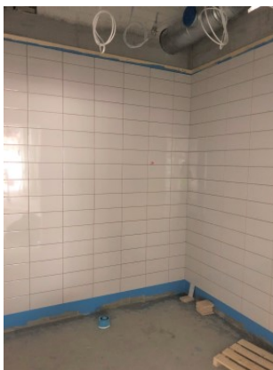
Märkätilojen laatoitustyöt etenevät