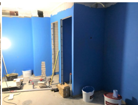
Laattapohjien vesieristystyöt käynnissä K2 krs.