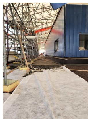
Vesikaton valutyöt käynnissä