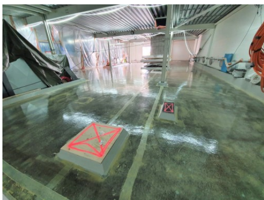
IV-konehuoneen lattian pinnoitusta

Julkisivumuuraus käynnissä pohjoispäädyssä